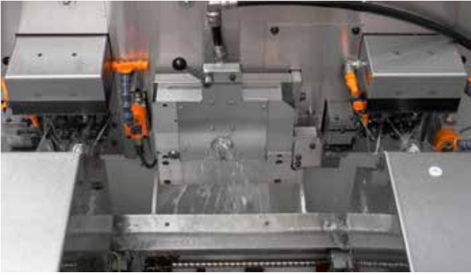
Les stations jumelles NM6 en action.