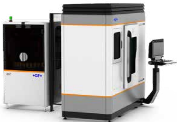
ML5 - Automatisé à l'intérieur et l'extérieur pour une productivité maximale

Les lasers à impulsions ultracourtes ont quitté les bancs optiques de la R&D et sont devenus un outil à part entière de la microfabrication médicale au cours des deux dernières décennies. Ces progrès dans les équipements de fabrication aident à réduire les coûts par pièce (et au final par intervention médicale) et donnent aux ingénieurs de conception plus de flexibilité pour créer la prochaine génération de composants médicaux.