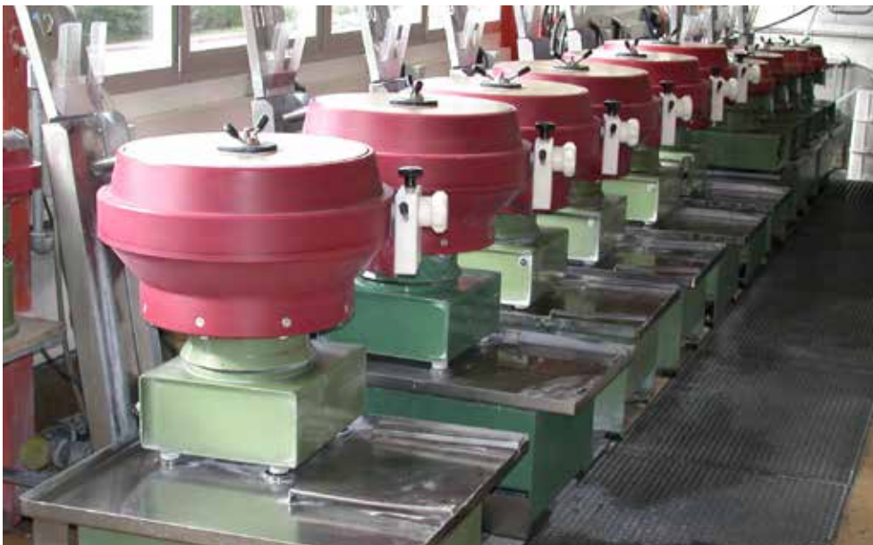
Atelier de polissage.

Der CEO sagt ganz offen, dass Micro-Finish nicht zu den Unternehmen gehört, die in der Waadtländer Industriewelt in aller Munde sind. Nichtsdestoweniger zählen die großen Uhrenmarken zu seinen Kunden, da die hervorragende Beherrschung der Endbearbeitungsverfahren sehr geschätzt wird. So haben Audemars Piguet, Bovet, Chopard, Omega, Panerei, Richard Mille, Rolex,