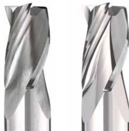
Fraises avant (g.) et après le traitement de surface avec Otec Streamfinish. Fräser vor (li) und nach der Oberflächenbearbeitung mit Otec Streamfinish. Cutter before (l.) and after the surface treatment with Otec Streamfinish.

Die Otec Präzisionsfinish GmbH bietet Präzisionstechnologie für die Erzeugung perfekter Oberflächen. Maschinen von Otec zum Glätten, präzisen Kantenverrunden, Polieren und Entgraten dienen zur rationalen Oberflächenveredlung verschiedenster Werkstücke. Mit einem Netz aus internationalen Handelspartnern ist Otec weltweit kundennah vor Ort vertreten. Verschiedenste Branchen wie Werkzeugindustrie, Automobilindustrie, Luft- und Raumfahrt, Medizintechnik sowie die Uhren- und Schmuckbranche profitieren vom umfassenden Know-how des Technologieführers Otec in der Entwicklung des perfekten Zusammenspiels von Maschine und Verfahrensmittel.