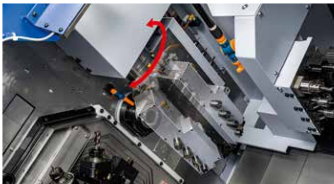
Zone d'usinage avec axe B.