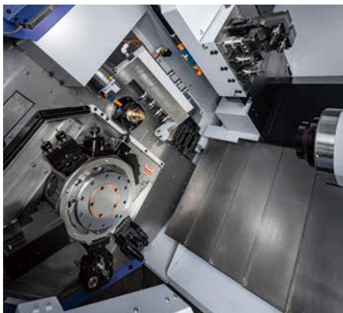
Zone d'usinage complète.