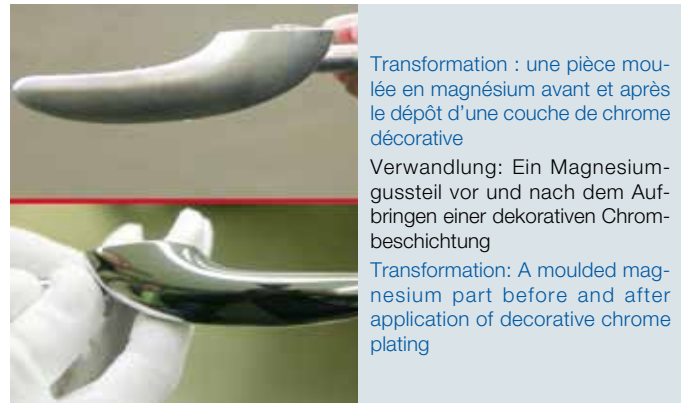
Transformation : une pièce moulée en magnésium avant et après le dépôt d'une couche de chrome décorative

„Ein weiterer Aspekt, auf den wir großen Wert legen, ist ein sehr hohes Qualitätsniveau unserer Anlagen“, setzt C. Gmünder hinzu. Da die Ausrüstung in einem häufig stark korrosiven Umfeld funktionieren muss, legt man großen Wert auf eine sorgfältige Auswahl der Materialien und der verwendeten Komponenten. Die gleichen Rahmenbedingungen gelten selbstverständlich auch für die Technologien, die für die Kontrolle der Prozesse zum Einsatz kommen. STS Industrie sieht sich in der Pflicht, das Vertrauen, das ihnen ein Kunde schenkt, durch eine deutlich über dem