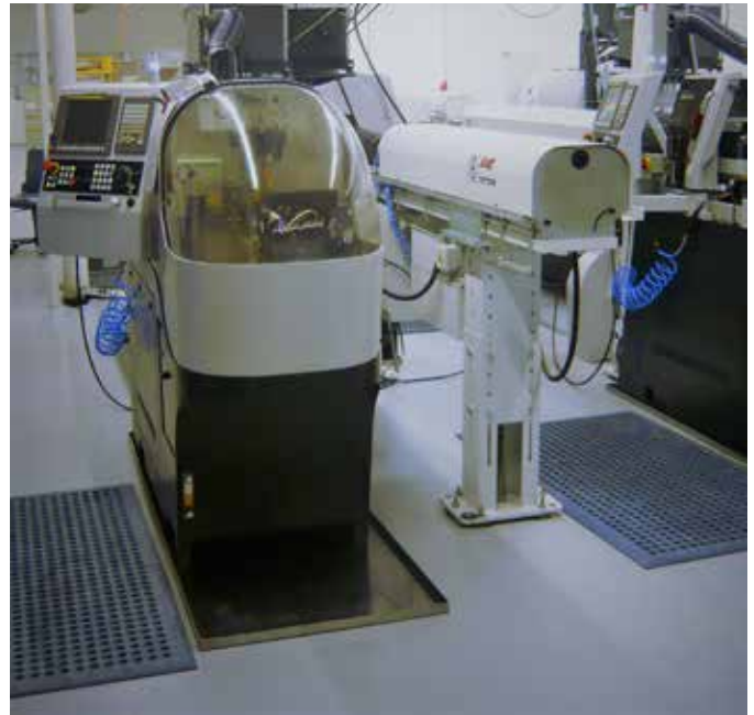
Tornos SwissNano: La spécialiste de la micro et nano précision.

Diese positiven Erfahrungen sind der Grund, warum die Swiss-Nano für die Ingun Prüfmittelbau GmbH auch künftig erste Wahl bleibt. Damit ist die Fahnenstange aber bei weitem nicht erreicht. Das Unternehmen denkt sogar über eine strategische Partnerschaft mit den Schweizern nach. Ingun wird in den nächsten Jahren weiter rasant wachsen und benötigt dafür Maschinen, auf denen sich die geforderte Mikropräzision schnell und flexibel realisieren lässt. Mit der SwissNano hat Tornos dafür die besten Voraussetzungen geschaffen.