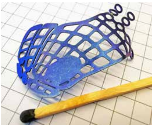
Implant en tôle de titane découpé au jet d'eau pour la réparation de fractures sévères, notamment dans la région du sourcil.

«La découpe au jet d'eau est une technologie relativement récente, encore trop peu connue de nombreux utilisateurs ou concepteurs», déplore W. Maurer. Cela constitue selon lui un obstacle important car un concepteur préférera généralement se tourner vers des procédés qu'il maîtrise. Le chef d'entreprise considère donc qu'il est essentiel d'aider les intéressés, un soutien qu'il est en mesure de leur apporter puisqu'il a non seulement mis au point cette technique mais qu'il en est aussi utilisateur, avec aujourd'hui une quinzaine de machines dans son atelier. Waterjet peut ainsi prodiguer à ses clients des conseils généraux mais il leur propose aussi de concevoir leur chaîne de process, de réaliser des tests sur des matériaux et d'effectuer des essais d'usinage. Il peut tester sur ses équipements les configurations, pressions et matériaux de coupe les plus divers et déterminer la combinaison optimale avant que l'intéressé ne se détermine. Cela inclut aussi la fabrication préalable de prototypes ou de préséries. Les clients peuvent aussi compter sur le soutien de l'entreprise après l'achat. Les utilisateurs bénéficient par ailleurs de l'effort continu de recherche et de développement entrepris par Waterjet en collaboration avec un ensemble d'universités et d'écoles d'ingénieurs. Les résultats de ces recherches leur sont directement profitables.