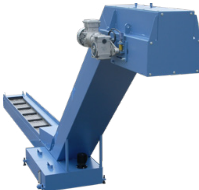
Convoyeur avec bac.

Die zweite für den Decolletage-Bereich bestimmte Produktreihe umfasst Combi-HP-Förderanlagen. Dieses mit einem Doppelförderer ausgestattete Gerät bietet eine automatische Förderlösung