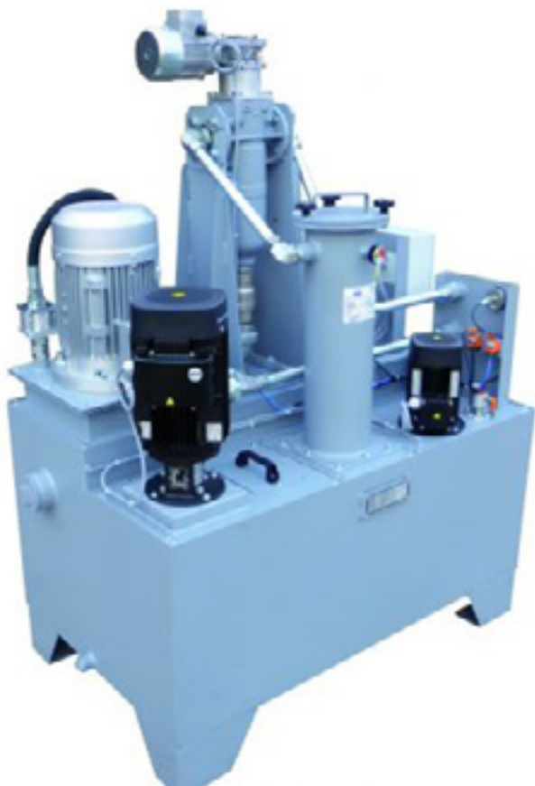
Centraflex 400 avec filtre de décolmatage automatique.

Heute konzentriert sich die Produktion von Novaxess Technology auf Bandförderer und Kratzerförderer, Förderschnecken und Magnetförderer sowie Bewässerungssysteme und Multifunktionspumpen. Das Unternehmen ist in Frankreich gut vertreten und exportiert auch in mehrere europäische Länder sowie in die Maghreb-Länder.