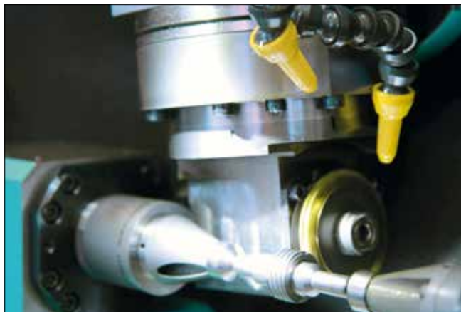
La réalisation de vis sans fin droits ou hélicoïdales de petites dimensions est garantie par la nouvelle 'Unit 90'.

specific tool between two milling cutters. To conclude on this first piece of news, Mr. Giran adds: "We are specialised in gear-cutting and perfectly master this operation. With the double clamping we offer not only a productive solution, but also a very high quality of gear-cutting" . Presented at the EPHJ in Geneva, this solution has generated many requests and has already been sold. The first deliveries are planned for this year already.