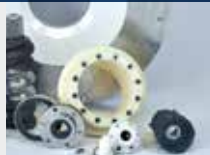
Keramik im Verbund Céramique assemblée Ceramic assemblies

Your experts in silicon nitride and carbide, oxid ceramics and graphite