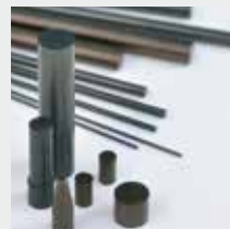
CeSinit® Lagerprodukte CeSinit® produits en stock CeSinit® stock products