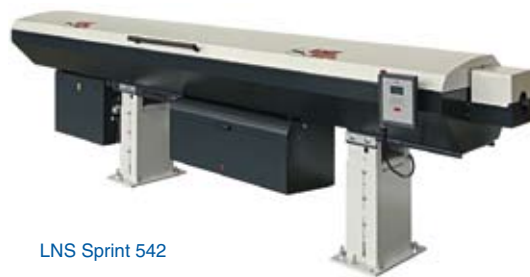
LNS Sprint 542

Dans le domaine des machines outils, les expositions restent un des outils les plus efficaces pour promouvoir son offre et l'image de son entreprise. Dans cet optique, EMO reste une manifestation incontournable, c'est « la plus grande ». Les nombreux fabricant interviewés pour Eurotec et notre blog ( www.eurotec.ch ) nous ont confirmés leur souhait de participer pour démontrer leurs compétences,