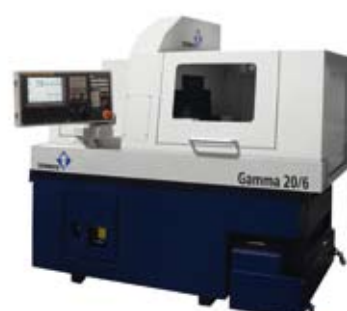
Tornos Gamma 20/6

Aussteller ausmachen und aus 34 Ländern kommen. Zehntausende Besucher werden im Oktober in die lombardische Hauptstadt reisen und feststellen können, dass das Angebot der Messe alle Nischen der Branche abdeckt: Vom Umformen von Werkstoffen bis zur Zerspanung, von der Ausrüstung bis zum Werkzeug, von der Robotik bis zur Automation.