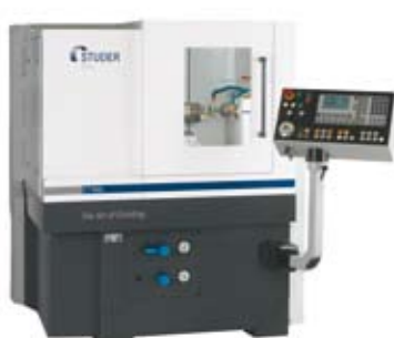
Studer CT 450L