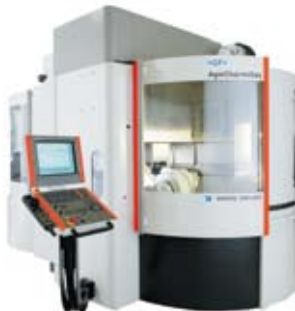
Micron XSM 400U