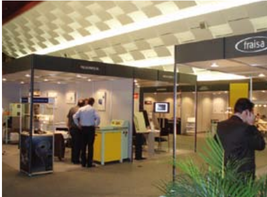
the Ecole Polytechnique Fédérale de Lausanne. As for watchmaking, this section is full.