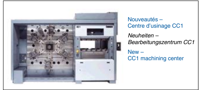
Nouveautés – Centre d'usinage CC1 Neuheiten – Bearbeitungszentrum CC1 New – CC1 machining center