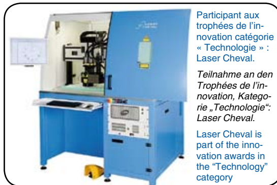
Participant aux trophées de l'innovation catégorie « Technologie » : Laser Cheval.

In 2002, Industrie launched its first edition with a dual objective: to value innovative products of the 10 sectors represented at the fair, but also to allow the decision-makers to discover exhibitors with remarkable performance and assets. An expert jury composed of industrial specialists, personalities and journalists will sort the participants of the 2013 issue. On Tuesday April 16, in the evening, the highly acclaimed innovation awards ceremony will celebrate the awards rewarded by influential personalities of the region and from the industrial world. The 700 guests will benefit from a unique atmosphere for an exceptional evening where good humor and friendliness will be the key words.