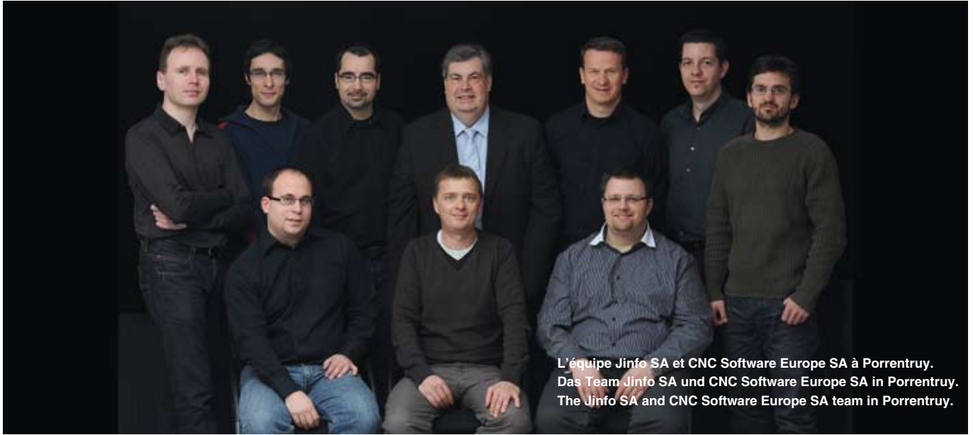
L'équipe Jinfo SA et CNC Software Europe SA à Porrentruy. Das Team Jinfo SA und CNC Software Europe SA in Porrentruy. The Jinfo SA and CNC Software Europe SA team in Porrentruy.

En cette année anniversaire, Jinfo SA a souhaité associer ses clients en présentant quelques-uns des produits réalisés avec ses solutions de CAO, FAO et PLM. Aujourd'hui, Jinfo complète son offre avec Mastercam, la FAO la plus utilisée dans le monde, et présente les nouvelles versions de Creo, GOelan et Mastercam Swiss Expert.