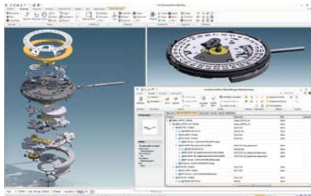
Création de mouvements horlogers avec Creo Elements/Direct. Schaffung von Uhrwerken mit Hilfe von Creo Elements/Direct. Creation of watch movements with Creo Elements/Direct.

These environments include: 3D modeling of the machine, axes kinematics, tools and tools position management, specific