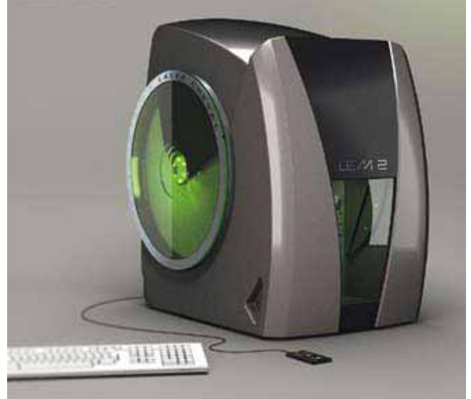
Design et efficacité sont au rendez-vous de LEM 2, la nouvelle machine de gravage et de micro découpe présentée par Laser-Cheval.