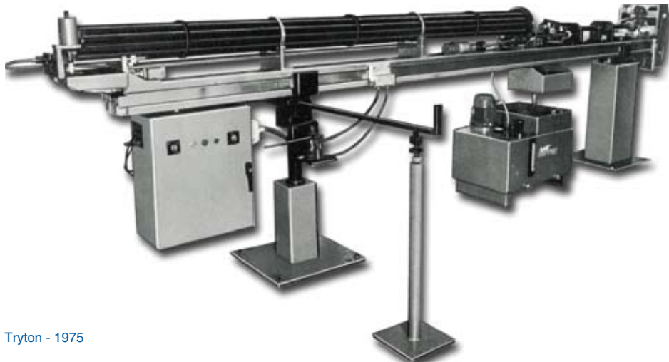
Tryton - 1975

En augmentant le confort de travail du décolleteur du village, les fondateurs de LNS ne se doutaient pas que 40 ans plus tard, l'entreprise serait un partenaire indispensable au bon fonctionnement des machines-outils sur l'ensemble de la planète.