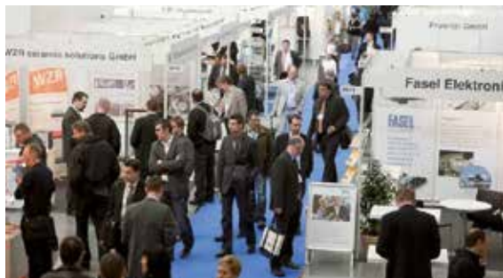
Medtec Europe, Messe Stuttgart, Germany

Die Medtec Europe ist für Besucher kostenlos, die sich vorab online registrieren. Die Registrierung vor Ort ist kostenpflichtig.