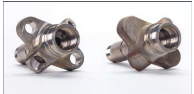
Différentes opérations de perçage et de fraisage sont effectuées par usinage sur l'ébauche en acier trempé.

Die Anlage besteht aus drei verketteten Modulen mitsamt Übergabeeinrichtung (bei Mikron W-Arm genannt), die eine kurze Wechselzeit zwischen den Modulen sicherstellt. Die einzelnen Bearbeitungsschritte an Fräs- und Bohroptionen haben es in sich. Da Mikron immer für Lösungen aus Maschine und Werkzeug steht, musste unter anderem die Herausforderung einer Tieflochbohrung mit sehr kleinem Durchmesser gelöst werden. Hauptprozess bei der Bearbeitung der Düsenhalter ist eine hochpräzise Tieflochbohrung als Durchgangsbohrung durch die gesamte Länge der Düsenhalter von 90 mm. Dabei hat die Bohrung einen Durchmesser von lediglich 1,5 mm. Während sich bei einer Version des Produkts genau in der Mitte eine Kammer befindet und die Bohrung deshalb von zwei Seiten angegangen werden kann, erfordern zwei Varianten des Düsenhalters eine Bohrung in einem Durchgang. Münch betont die Besonderheit: „Sind schon die Bohrungen mit 30 x d nicht alltäglich, so ist die Herstellung einer Tieflochbohrung von 60 x d äußerst anspruchsvoll.“ Die hochpräzisen Bohrungen durch den sehr festen Vergütungsstahl 42CrMo des Düsenhalters sind eine wichtige Voraussetzung für ein sicheres Funktionieren der Einspritzdüsen, denn sie dienen später als Führung und Halterung für die noch feineren Einspritzdüsen.