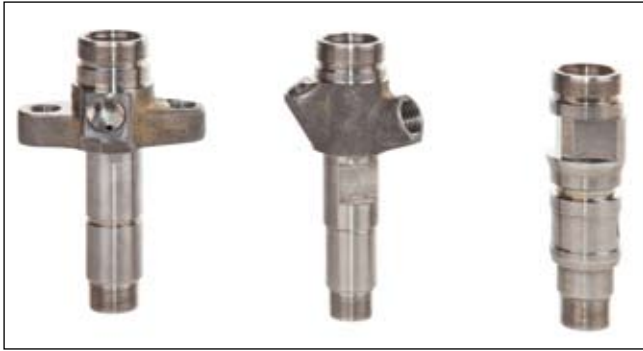
Un gros sous-traitant automobile chinois fabrique trois modèles de porte-injecteurs pour pompes d'injection Common Rail sur un centre d'usinage Multistep XT-200 de Mikron.

Drei Varianten eines Düsenhalters für Common Rail Diesel-Einspritzpumpen fertigt ein großer chinesischer Automobilzulieferer auf einem Bearbeitungszentrum Multistep XT-200 von Mikron.