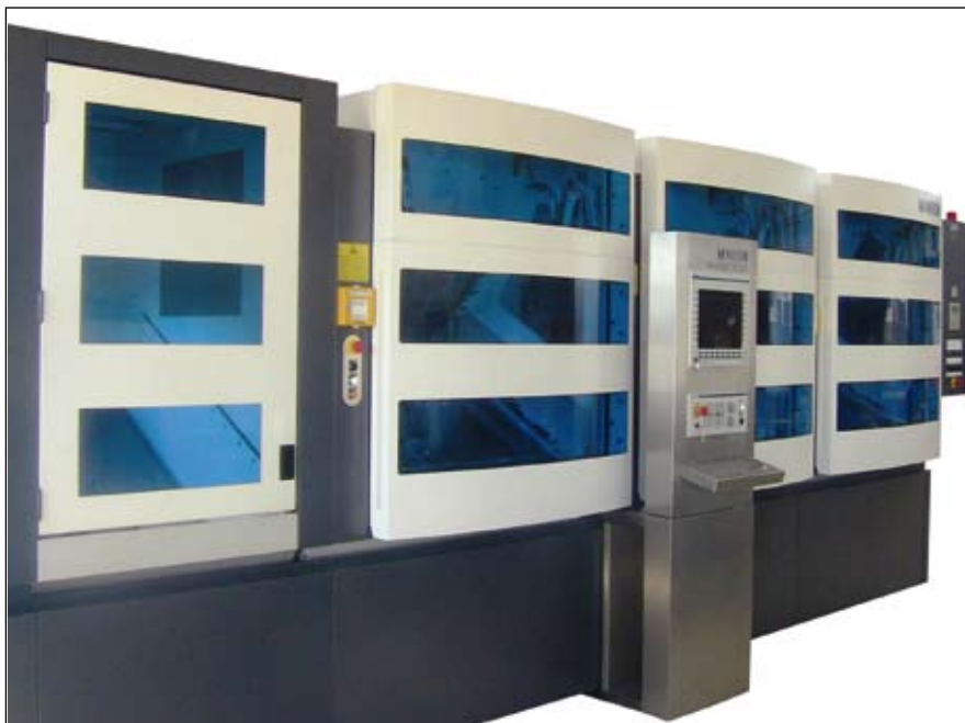
Système d'usinage modulaire Multistep XT-200 de Mikron pour un sous-traitant automobile chinois.

de refroidissement. On utilise ici de l'huile pour perçage profond qui est injectée à une pression de 140 bars. « Pour obtenir un processus stable, nous refroidissons l'huile à une température constante dans un dispositif réfrigérant intégré à l'installation », explique le chef de projet Alexander Amann. Un second foret pour perçages profonds est utilisé également dans le troisième module pour ébavurer d'abord mécaniquement les intersections de perçages transversaux. L'ensemble de la pièce du client sera ébavuré définitivement plus tard dans le