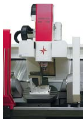
Qu'il s'agisse de l'usinage sur 5 faces ou de l'usinage simultané sur 5 axes, le centre d'usinage à 5 axes T7 Single, équipé d'une broche principale orientable sans palier et d'un plateau circulaire intégré à commande numérique, séduit par des performances d'usinage élevées et des cotes d'installation compactes dans la production à l'unité et en petites séries.

The factory located in Meppen in Lower Saxony, develops and manufactures high-performance CNC vertical machining centres since 1967. The product range includes three, four and five axis models with various kinematics and is sold across Europe. Its customers include machinery manufacturers and their suppliers active in the sectors of agricultural machinery, aerospace, automotive, packaging and many others. Today, this tradition-rich family business employs more than 160 highly skilled people in the Northwest of Germany and operates state of the art machining centers on more than 12'000 sqm.