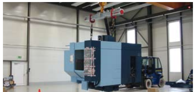
En plein déménagement, les machines d'exposition sont mises en place.