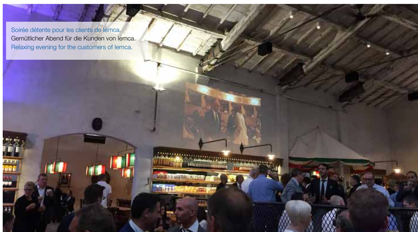
Soirée détente pour les clients de lemca. Gemütlicher Abend für die Kunden von lemca. Relaxing evening for the customers of lemca.

Am Ende des ersten Tages wurden hunderte Gäste zu einem unvergesslichen Abend in die Casa Spadoni – alte Getreidemöhlen des gleichnamigen Lebensmittelkonzerns, die in eine