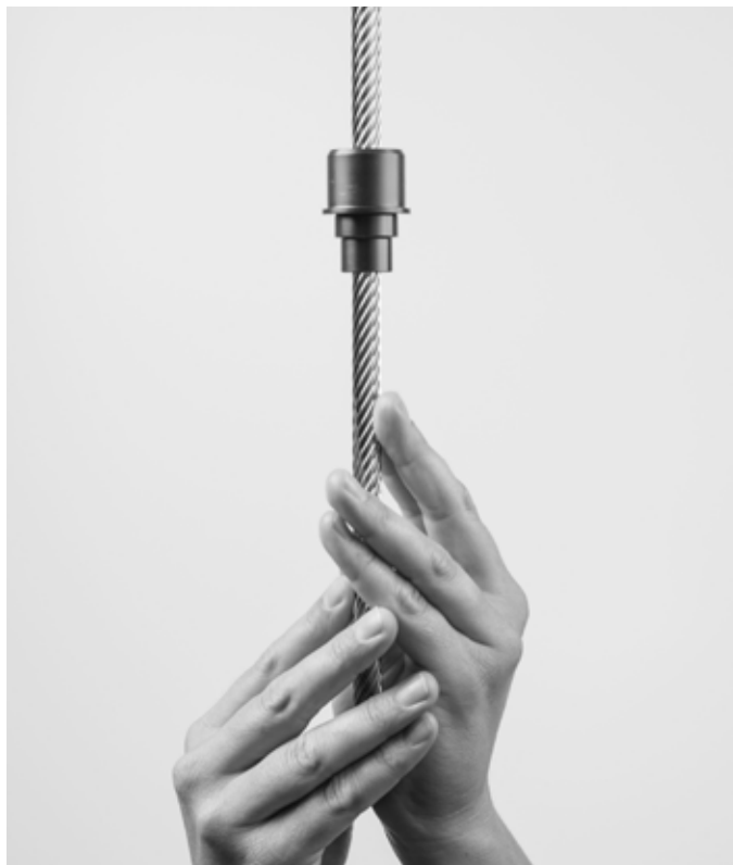
L'original, l'archétype de Speedy, diamètre 10 mm, pas 50 mm Das Original, Urtyp Speedy, Durchmesser 10 mm, Steigung 50 mm The original, Speedy archetype, diameter 10 mm, pitch 50 mm

dinaires de Speedy sont dues en partie à la perfection de l'association entre la vis roulée et l'écrou en plastique. Il existe plus qu'une poignée d'excellents fournisseurs de matière plastique qui proposent des spécialités techniques. Le fabricant suisse de vis roulées entretient des contacts avec eux et est indépendant car il n'est pas lié à une matière première particulière. En conséquence, il est possible de sélectionner dans la gamme le bon plastique pour l'application demandée et de le recommander au client.