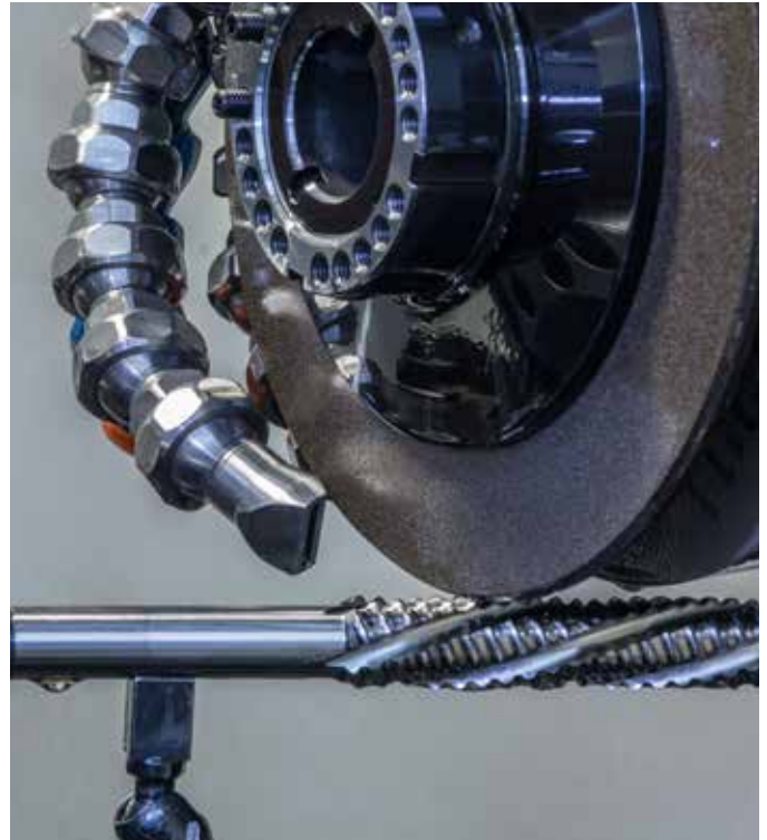
Affuteuse d'outils Werkzeugschleifmaschine Tool grinding machine

We live in the most efficient society ever. People require technologically based comforts. This will be the case in future too. For drive systems, users are now increasingly looking for economic, energy-saving overall solutions with low operating costs and machinery manufacturers expect a technological advance which reinforces its position in competition. The requirements for automated movement processes are therefore increasing at an unstoppable rate. Mechanics boosts and requires this necessity for the solution of practical tasks.