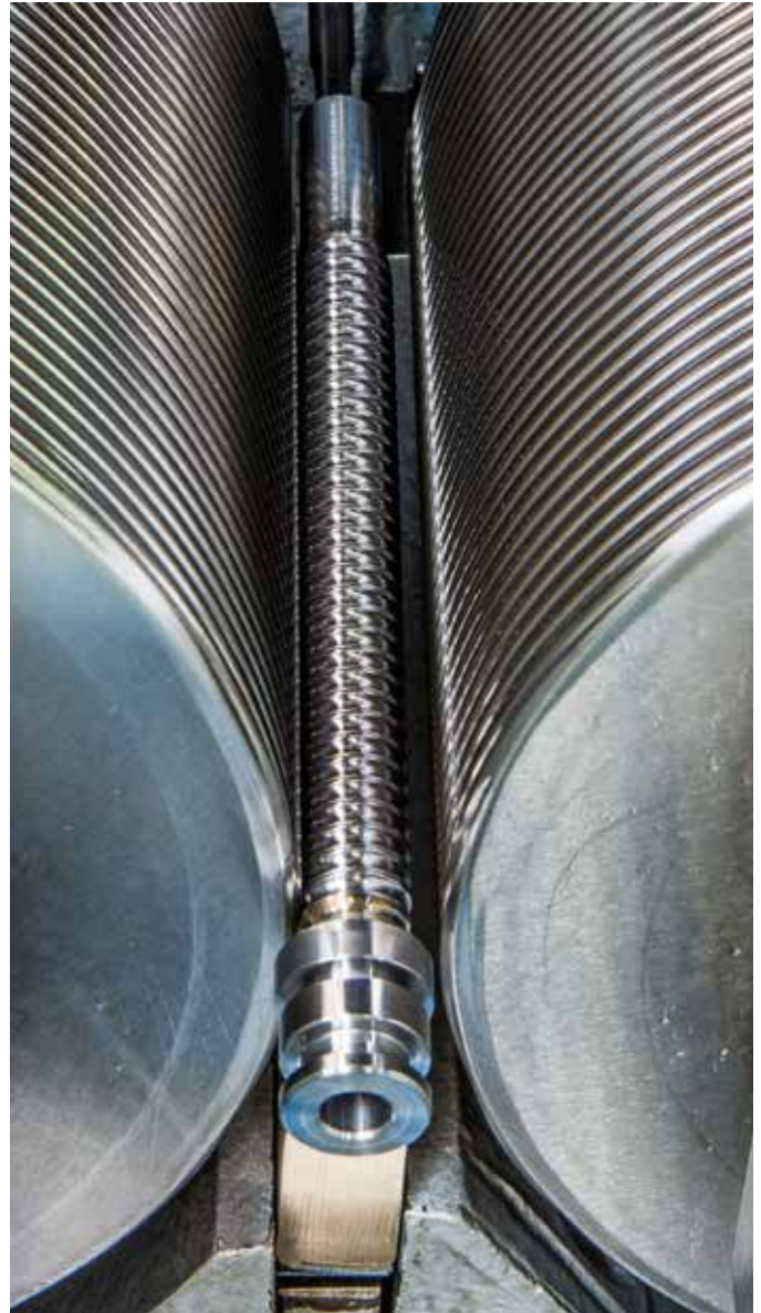
La fabrication de vis roulées comme compétence centrale: processus à une passe. Kernkompetenz Gewinderollen: Einstechverfahren. Core competence thread rolling: Infeed process.

The Swiss thread roller is in contact with them and is independent as it is not bound to a certain raw material. Accordingly, the correct plastic can be selected for the required application from the range and recommended to the customer.